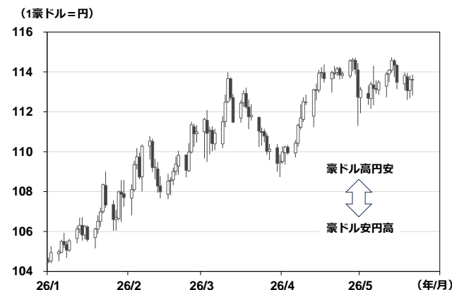
【図表②】 豪ドル円相場（日足）

作成: 岡三証券 月次 直近は2026年4月分