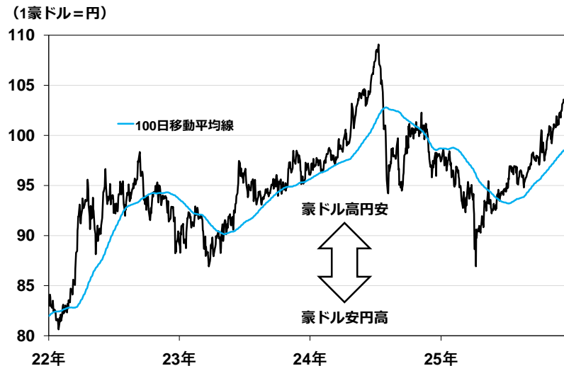
【図表②】豪ドル円相場

作成: 岡三証券 日次 日本時間12月9日午後1時時点