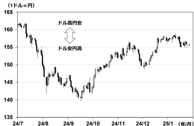
【図表②】 ドル円相場 (日足)

作成:岡三証券 日本時間1月27日午前8時時点